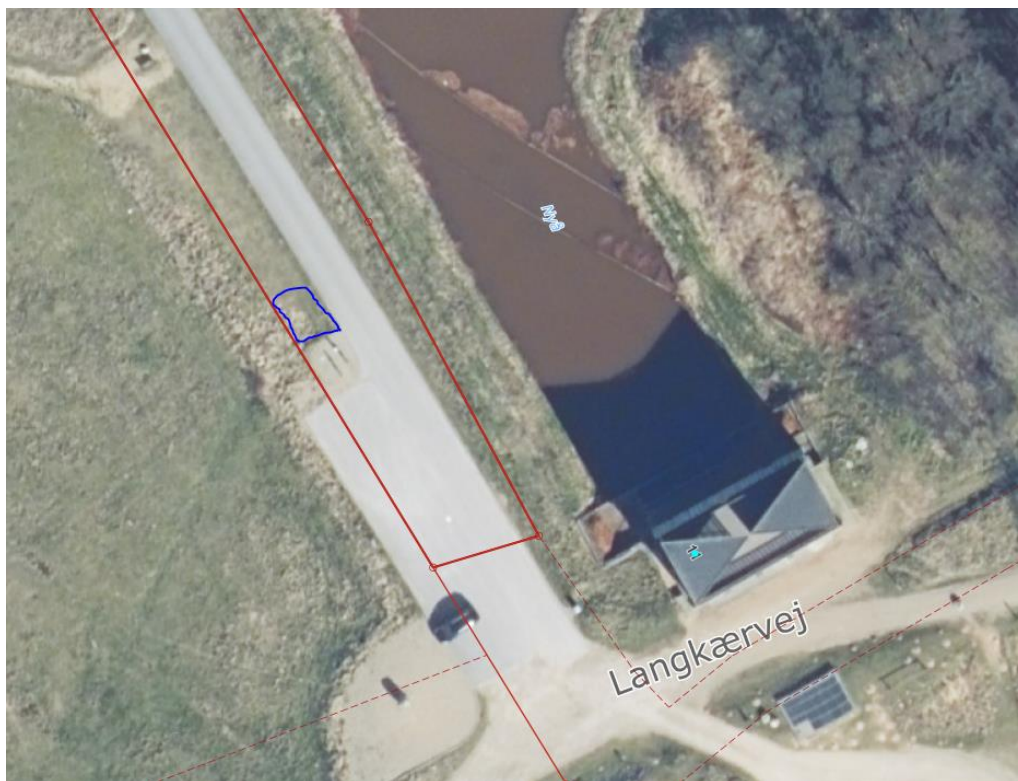
Figur 5 – Placering af ladestandere til elcykler nær Pumpestation Nord

Ladestandere til elcykler ved Pumpestation Nord nær Langkærvej 11, 6900 Skjern placeres indenfor det markerede område vist på figur 1.