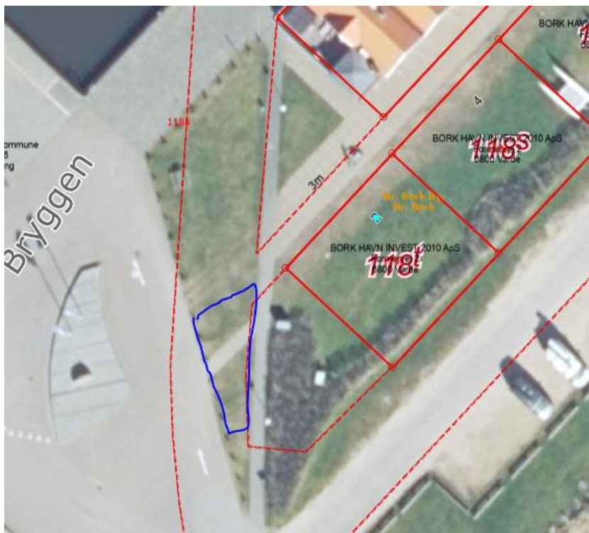
Figur 2 – Placering af ladestandere til elcykler ved Bork Havn

Ladestandere til elcykler ved Pumpestation Nord ved Bork Havn, Bryggen 2, 6893 Hemmet placeres indenfor det markerede område vist med blå på figur 1