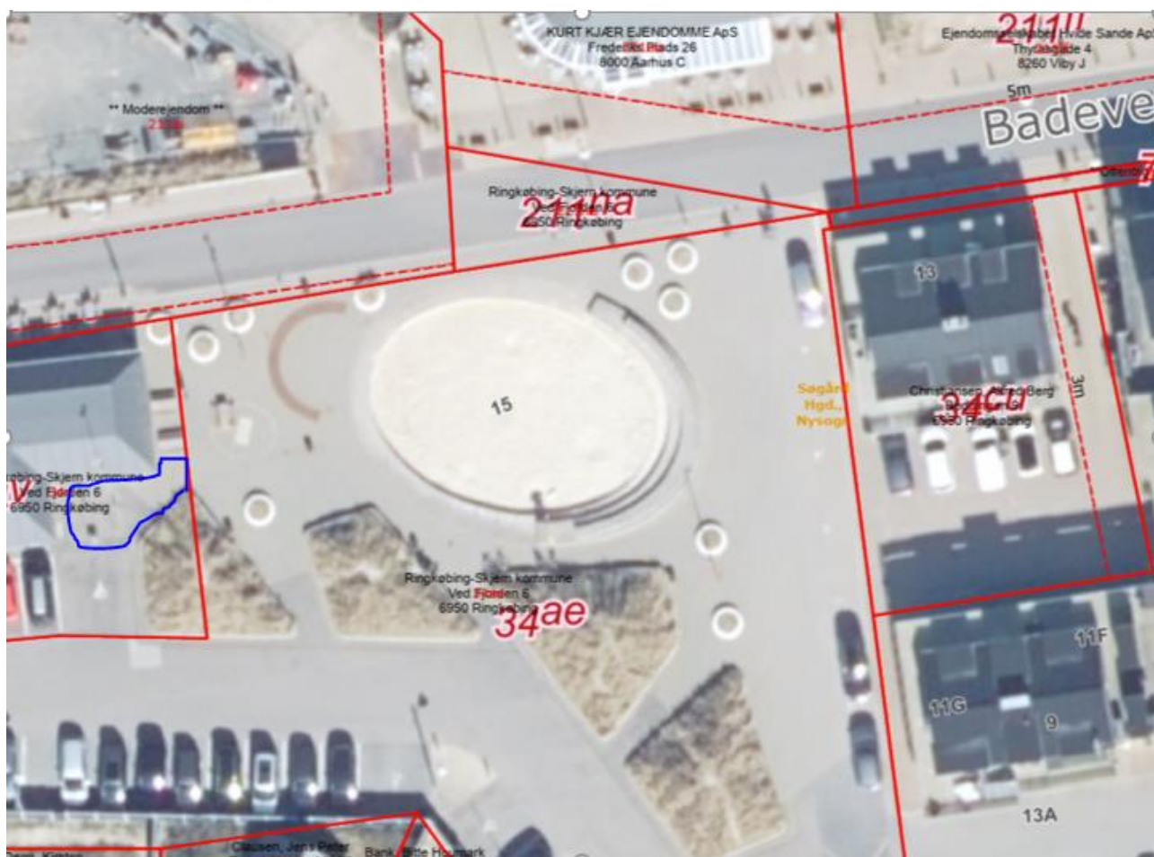
Figur 8 – Placering af ladestandere til elcykler på Badevej 17, Søndervig

Ladestandere til elcykler placeres på Badevej 17 indenfor området markeret med blåt på figur 1.