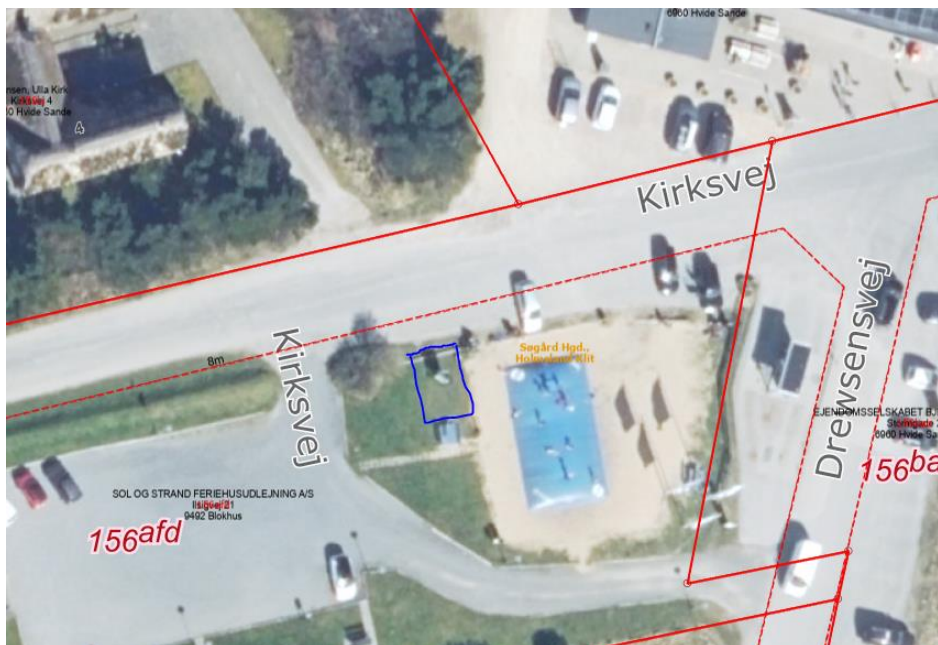
Figur 1 – Placering af ladestandere til elcykler ved Bjerregård

Ladestandere til elcykler i Bjerregård, Kirksvej 1, 6960 Hvide Sande, placeres indenfor det markerede område vist med blå på figur 1.