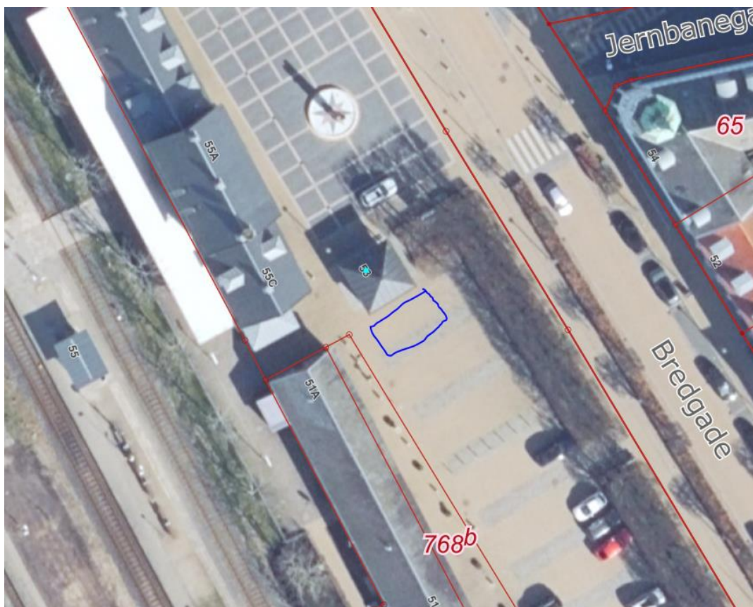
Figur 7 – Placering af ladestandere til elcykler i Skjern

Ladestandere til elcykler i Skjern placeres nær toiletbygningen Bredgade 53 indenfor området markeret med blåt på figur 1.