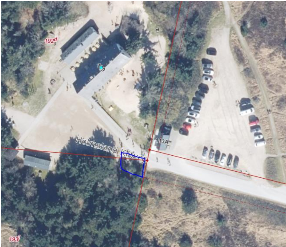
Figur 4 – Placering af ladestandere til elcykler ved Lyngvig Fyr

Ladestandere til elcykler ved Pumpestation Nord ved Lyngvig Fyr, Holmsland Klitvej 107-109 placeres indenfor det markerede område vist på figur 1.