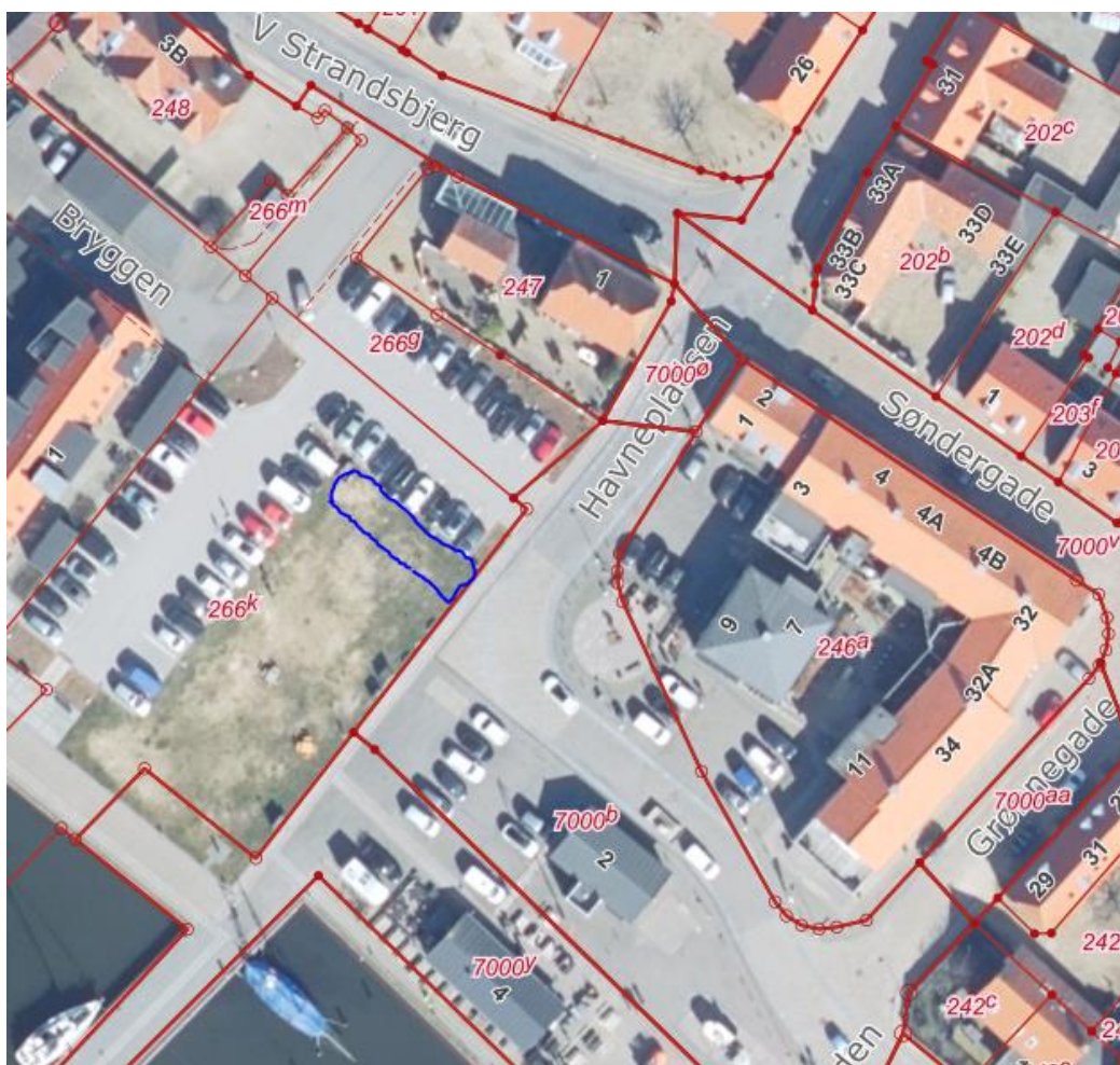
Figur 6 – Placering af ladestandere til elcykler på Havnepladsen i Ringkøbing

Ladestandere til elcykler placeres på Havnepladsen indenfor området markeret med blå på figur 1.